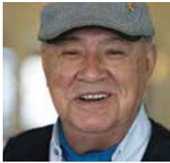
Eugene Arcand Nation crie de Muskeg Lake (Saskatchewan)

Un appel à candidatures pour les membres du Cercle de gouvernance et du Cercle des survivants a été lancé en 2025. De nouveaux membres supplémentaires seront annoncés en 2026.